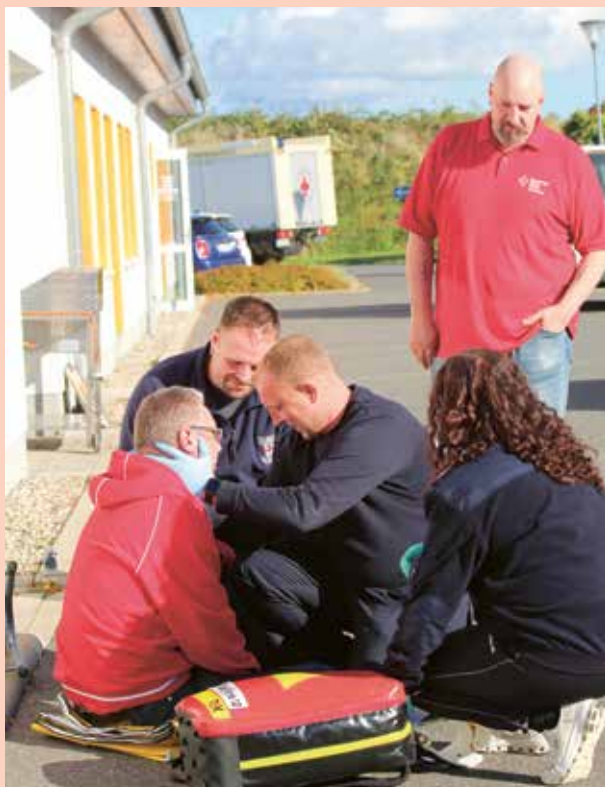
Das Bild zeigt eine realitätsnahe Trainingssequenz der First Responder-Ausbildung.